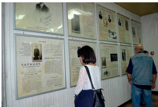
На отварању изложбе о Тихомиру Ђорђевићу, 24. мај 2018, Народна библиотека „Његош“, Књажевац

Извори коришћени за прикупљање грађе и приређивање изложбе о животу и делу Тихомира Ђорђевића били су разноврсни и обухватили су: Архив САНУ (Београд), Библиотеку Матице српске (Нови Сад), Завичајни музеј Алексинач, Народну библиотеку „Његош“ (Књажевац) и друге, али најзначајнији извор била је Народна библиотека Србије из Београда, где се налазе библиотеке-легати Тихомира Ђорђевића и сестара Љубице и Данице Јанковић, Ђорђевићевих сестричина.