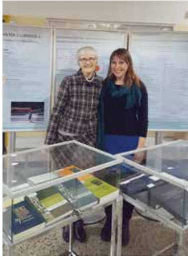
Изложба на Филозофском факултету у Љубљани