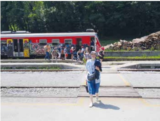
У сусрет теренском раду (2015)